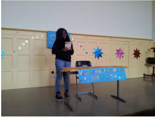
Beim Vorlesewettbewerb stellt jeder Klassensieger sein Buch vor.