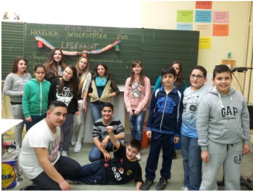
Wir freuen uns auf die Lesenacht!