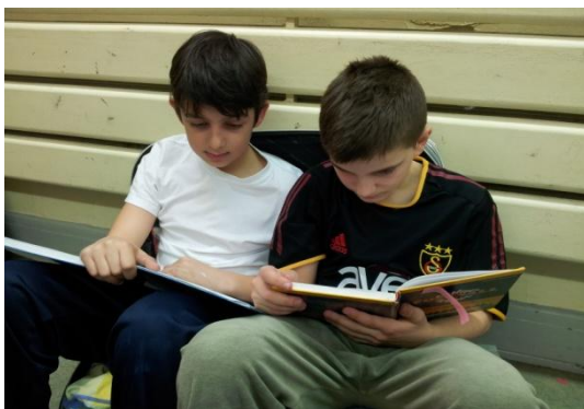
Die fleißigen Leser wählten ihre Bücher aus einer Bücherkiste der Stadtbibliothek aus.