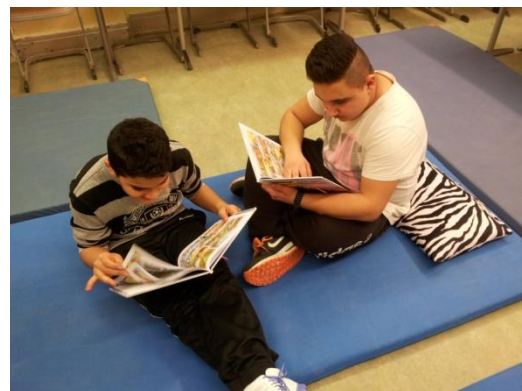
Das Lesen macht Spaß!

Nach einer spannenden Lesenacht frühstückten wir gemeinsam.