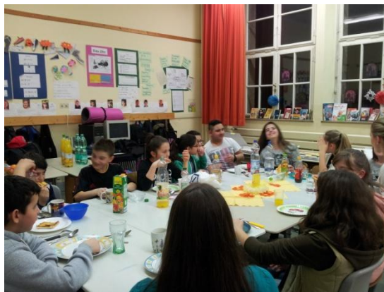
Vor dem Lesen stärkten wir uns mit einem gemeinsamen Abendessen.