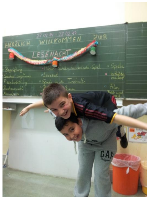
Abflug zur Lesenacht