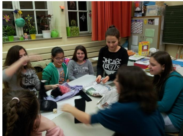
Der Nachtisch musste erspielt werden!